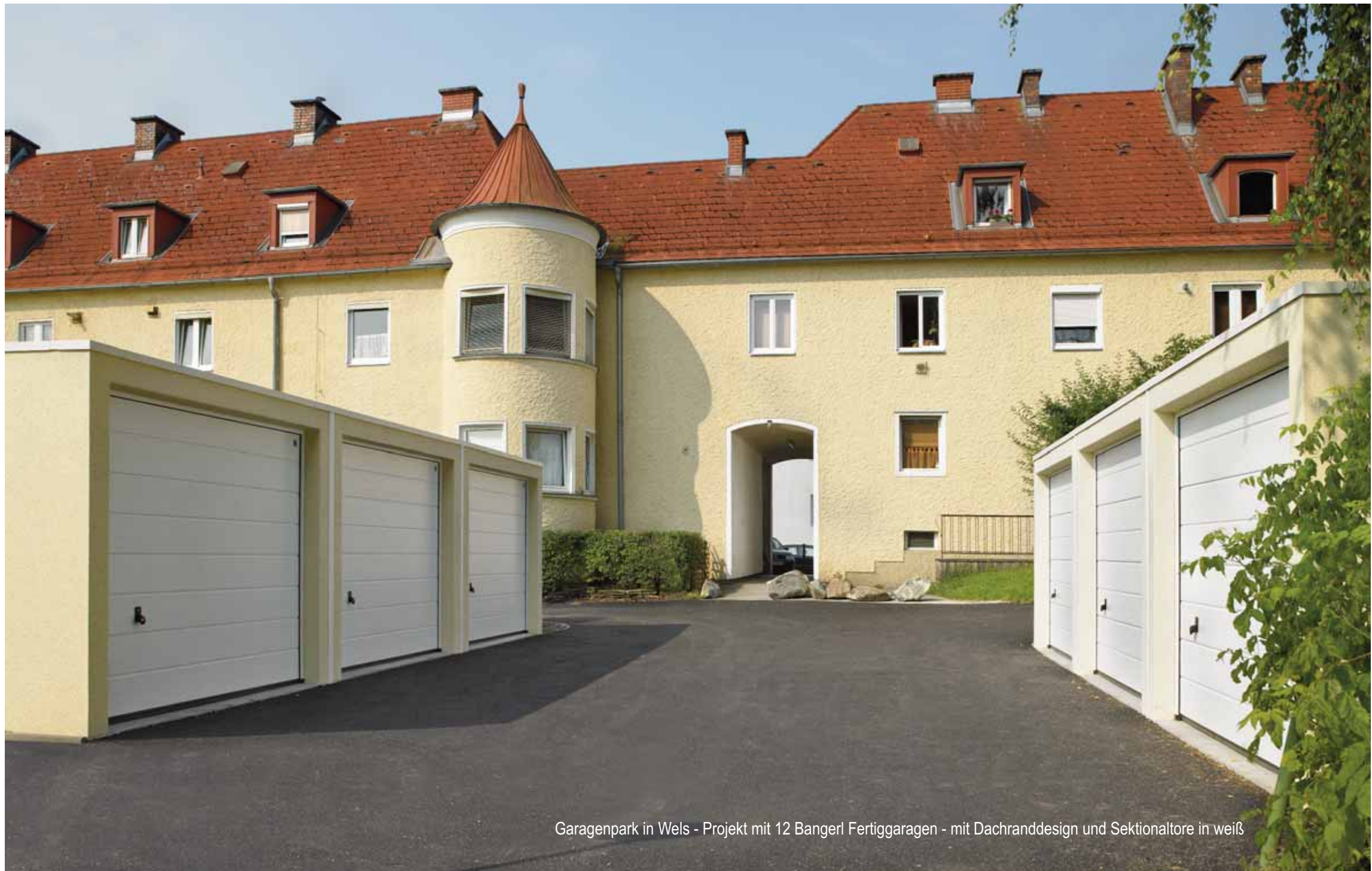
Garagenpark in Wels - Projekt mit 12 Bangerl Fertiggaragen - mit Dachranddesign und Sektionaltore in weiß