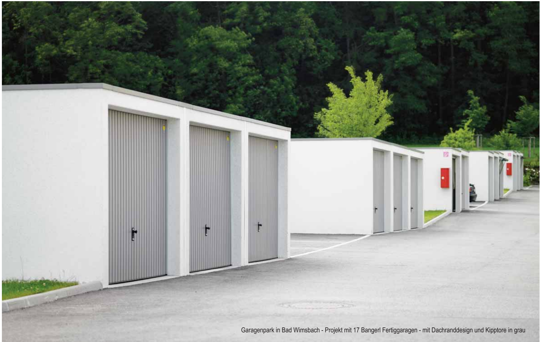
Garagenpark in Bad Wimsbach - Projekt mit 17 Bangerl Fertiggaragen - mit Dachranddesign und Kipptore in grau