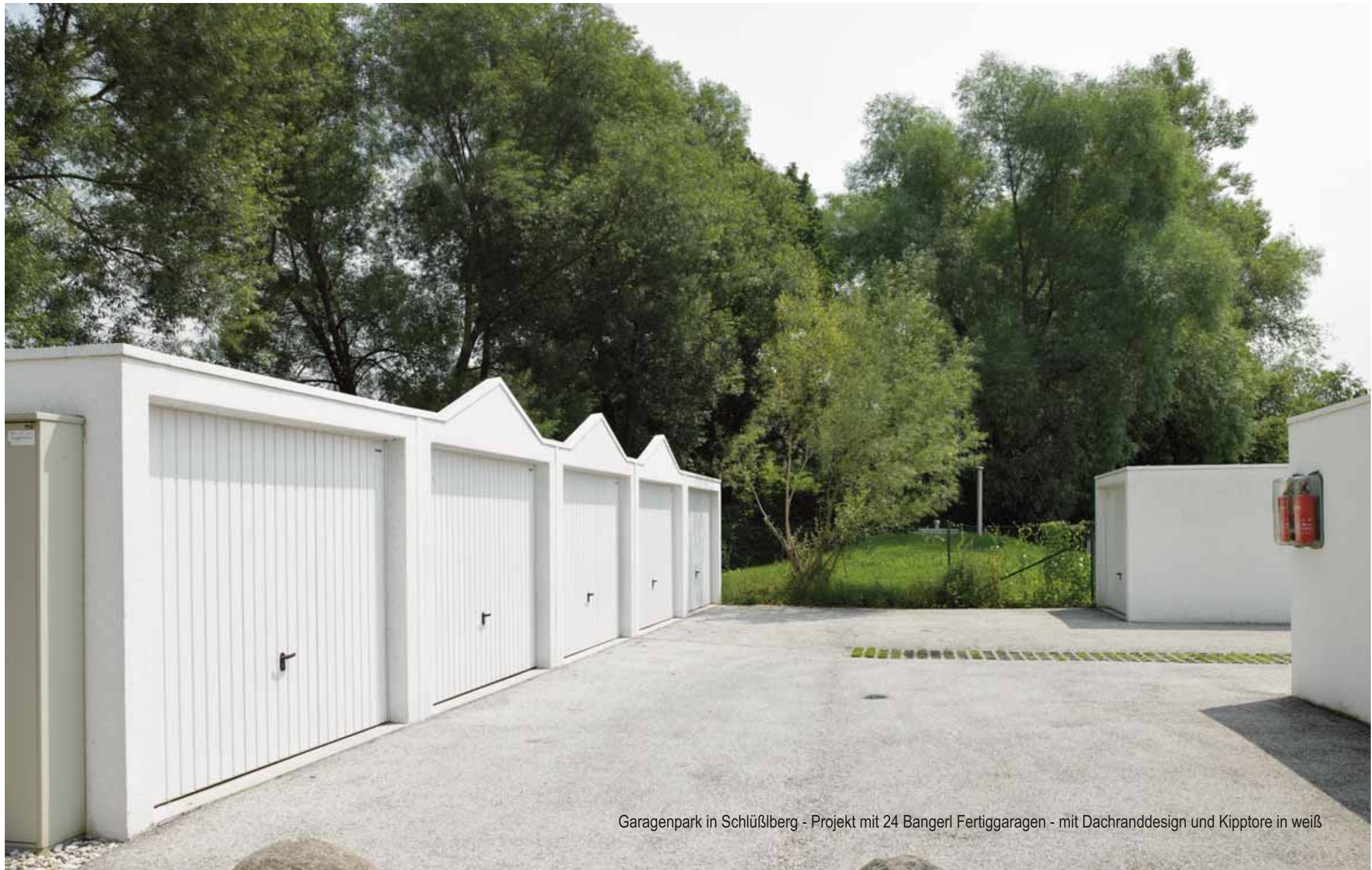
Garagenpark in Schlüßlberg - Projekt mit 24 Bangerl Fertiggaragen - mit Dachranddesign und Kiptore in weiß